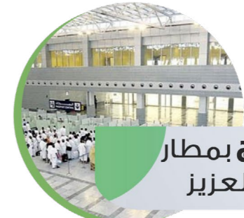
صالة الحجاج بمطار الملك عبدالعزيز

ضمن خطة نوعية متكاملة، وبعد دراسة الأعمال الميدانية السابقة، ووفقاً لنتائج البيانات والاحصائيات فقد تم تحديد هذه النقاط والشروع في العمل فيها وذلك لكثافة أعداد المستفيدين فيها والقدرة النوعية لفريق العمل الميداني.