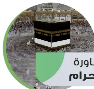
النقاط المجاورة للمسجد الحرام

استقبال الحجاج بحفاوة في صالة الانتظار بمطار الملك عبدالعزيز الدولي بجدة وتوزيع العبوات المبردة عليهم.